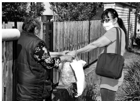
Önkéntes segítő munka közben