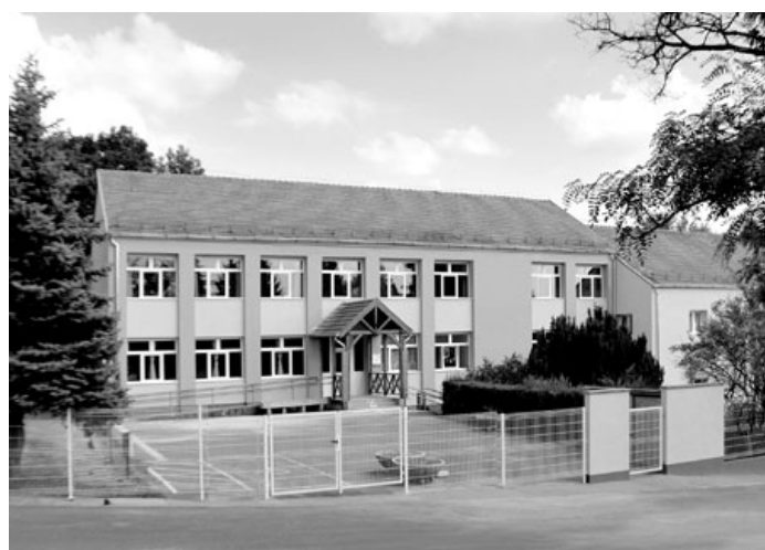
002. számú szavazókör - Általános Iskola