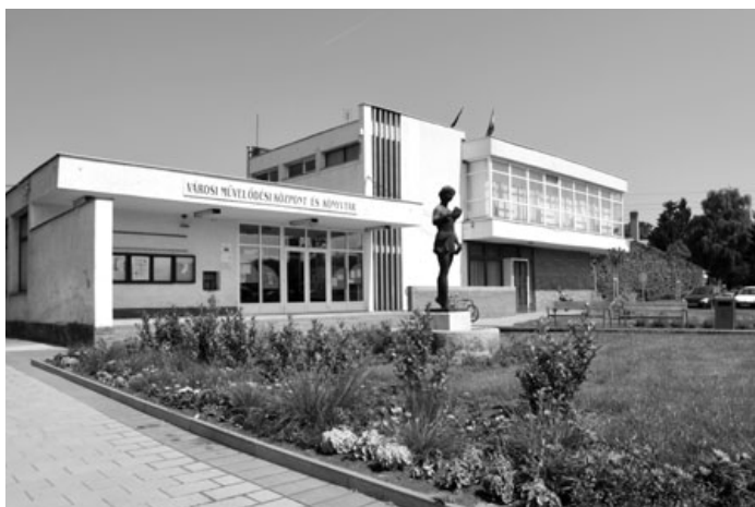
001. számú szavazókör - Művelődési Központ Átjelentkezők részére kijelölt szavazókör

Mindkét épület akadálymentesen megközelíthető, parkolási lehetőség is biztosított