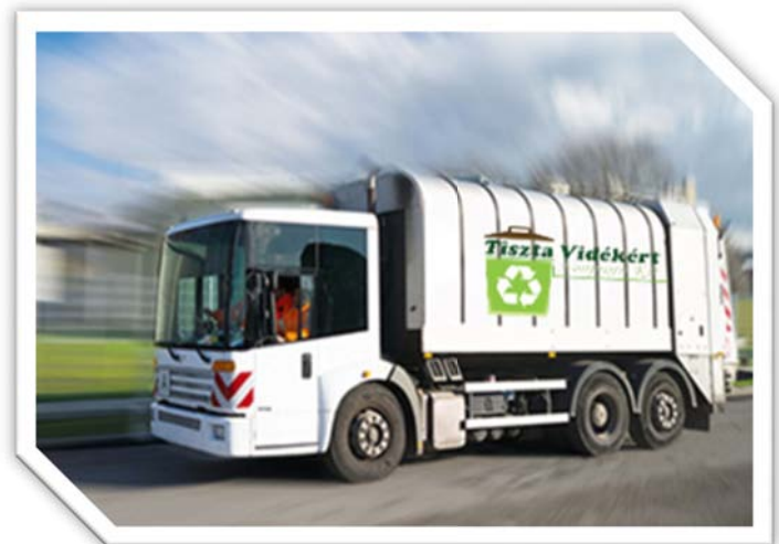
Kényszertömörítésű hulladékszállító gépjármű