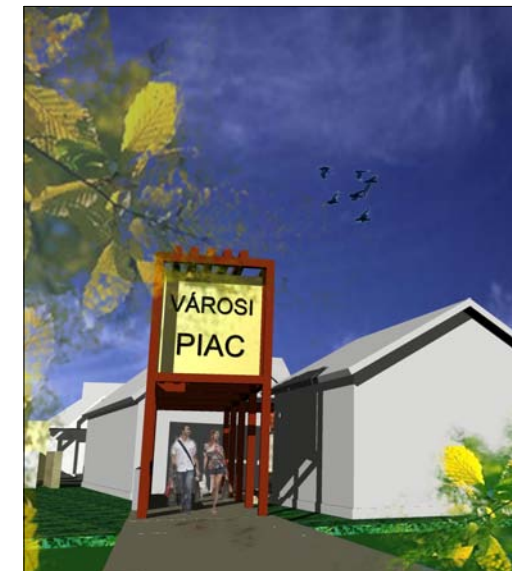
BUSZPÁLYAUDVAR FELŐLI BEJÁRAT