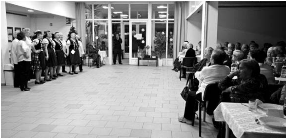
Fotó: Halász Enikő

és legnagyobb ünnepéhez kapcsolódtak. Ezennel vendégcsoport is fellépett. A Szátokei Asszonykórust hívták meg, akik igen szép programot mutattak be dallal, és néhány táncdal fűszerezve műsorukat.