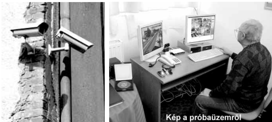
Kép a próbaüzemről

Hangadó – Rétság város lapja. Megjelenik havonta, 1250 példányban. A lap díjtalan.