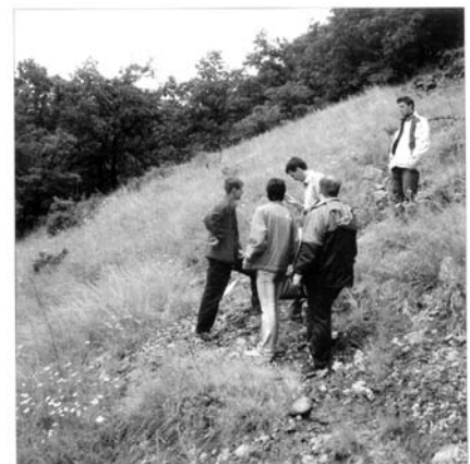
BÖRZSÖNY MÚZEUM BARÁTI KÖRE Szob, 2007